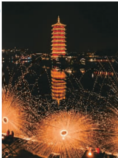
长沙铜官窑夜游景色“打铁花”。