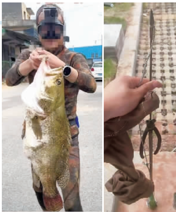
嫌疑人展示渔获(左图);警方查获的作案工具“射鱼器”(右图)。