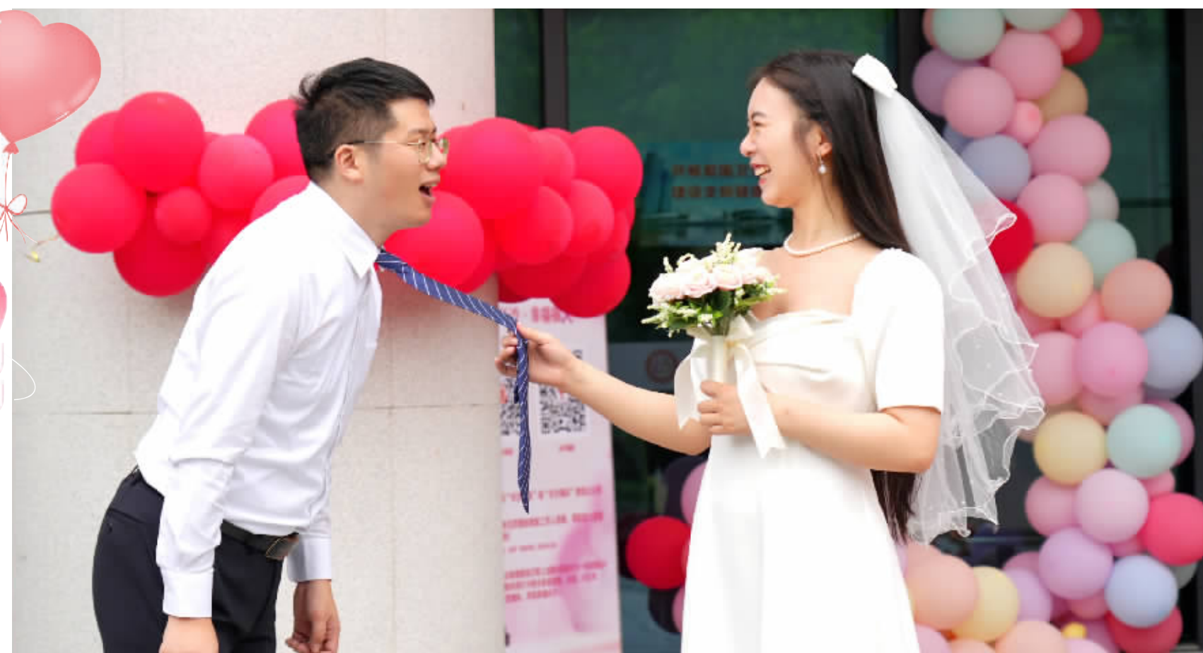
520,和最爱的人一起见证爱。组图/谢佳霖

除了玫瑰花、皮包、化妆品，黄金，珠宝也是“520”的“表白”常规配套之一。在周大福传承（王府井百货店），“黄金克减40元”“指定定价类92折”，“520”活动正在展开。尽管近期金价高企，店内足金（饰品、工艺品类）挂牌价格显示743元/克，依然没挡住情侣们的脚步，入店选购的消费者络绎不绝，一名女顾客拉住男伴，表示“我想多看一下”。 ■三湘都市报全媒体记者 叶竹