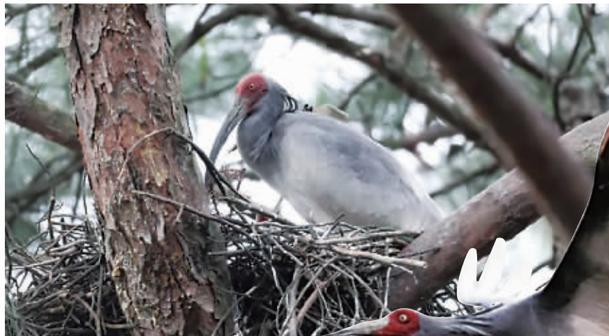
在世界自然遗产地崑山拍到的朱鹮。

2023年底，“鸚田一分”项目升级为“鱼稻轮作”觅食区，将觅食空白区域提升至50%，以此改善朱鹮觅食环境，提供更加丰富的食物来源，构成了一幅人、鸟、田、林和谐相依的美丽画卷。