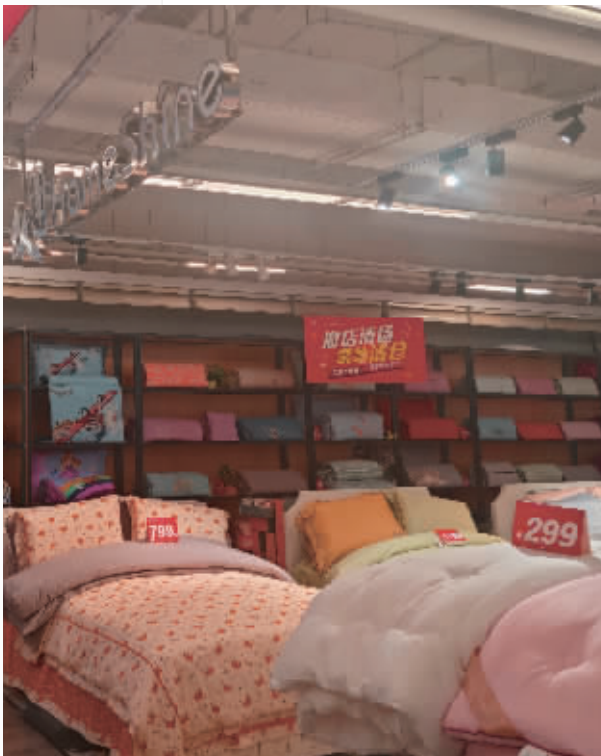
4月24日，华润万家长沙蔡锷路店家纺区挂出“撤店清场 紧急清仓”红色标牌。