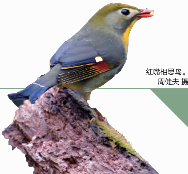
红嘴相思鸟。

值得一提的是,2023年6月8日,工作人员在南县水域的舵杆洲,惊喜地拍摄到2只青头潜鸭带着6只小鸭在水中嬉戏,这是在南洞庭湖自然保护区第一次拍摄到青头潜鸭繁殖的清晰影像。此次发现,创下目前已知的中国青头潜鸭繁殖纬度最南的纪录。