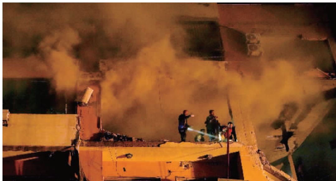
1月2日,救援人员在黎巴嫩贝鲁特南郊的以色列无人机袭击现场工作。