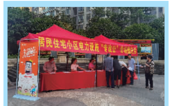
2022年9月28日,国网永州供电公司举行华源桥小区“一户一表”专场推进会