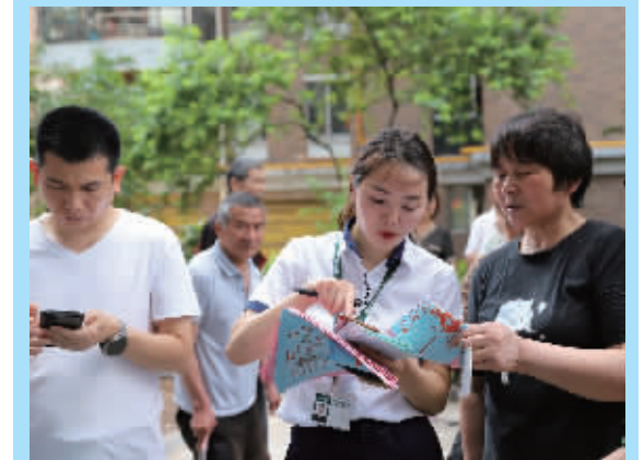
国网永州供电公司服务人员在江南幸福里小区向小区居民进行“一户一表”政策宣传