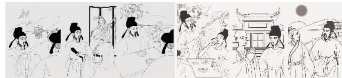
李松林用8幅插画还原刘禹锡千年前在常德的生活。