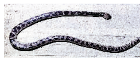
南山国家公园发现的花坪白环蛇。