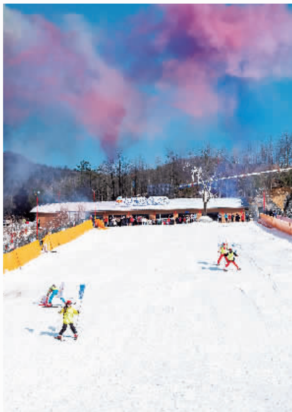
游客在七星山滑雪场滑雪(资料图)。