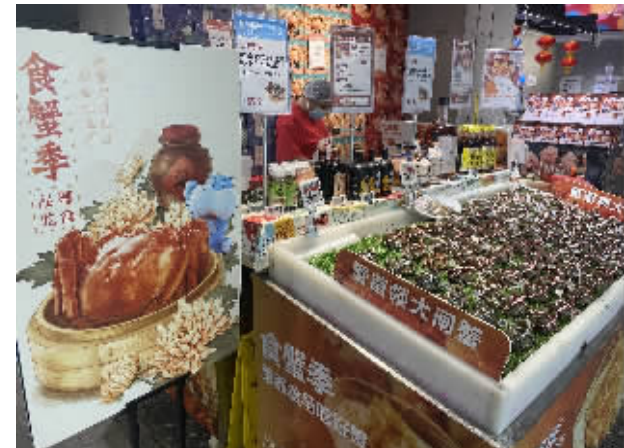
9月21日，长沙市各大商超和菜市场，大闸蟹已经上市，吸引不少市民前往挑选、购买。