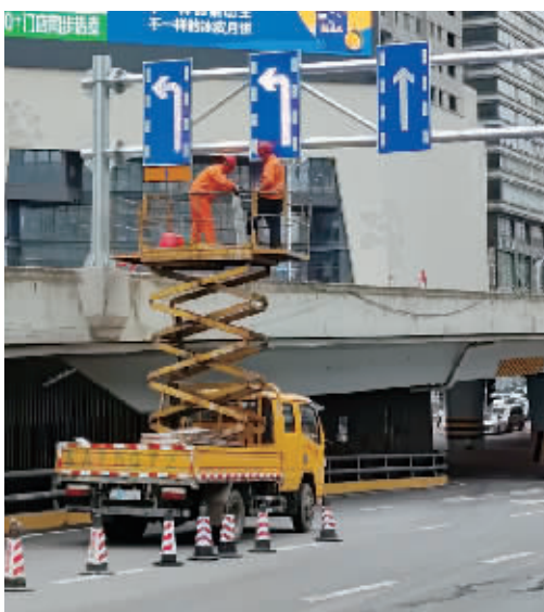
9月21日,长沙黄兴中路五一道路口东口,工人正站在高空作业车上安装可变车道指示牌。

交通信号灯相位和配时也进行了优化,确保行人过街绿灯通行时长,尽量减少红灯等待时间。粉红斑马线也进行了升级,采用专门定制的高科技粉红陶瓷颗粒,结合最新彩铺技术,使换新后的粉红斑马线外观更具时尚动感,“保鲜”周期更长。