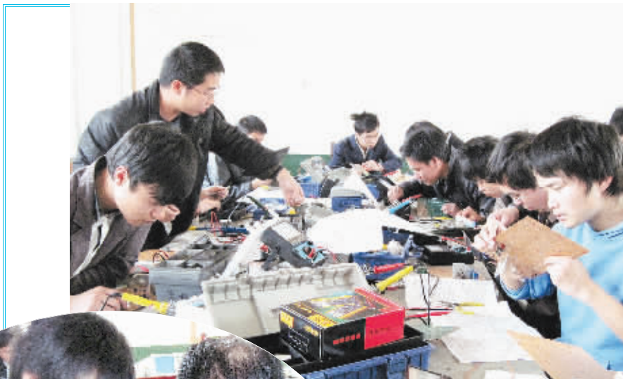
上图为该校学生在实训室进行实际操作