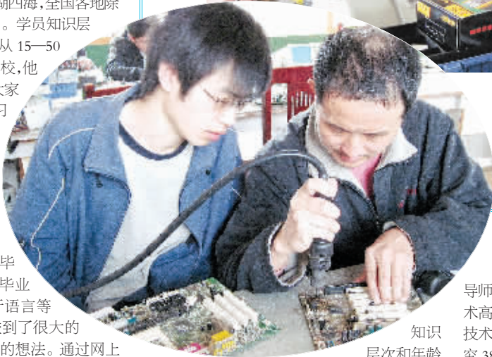
左图为该校老师在指导学生进行电子维修