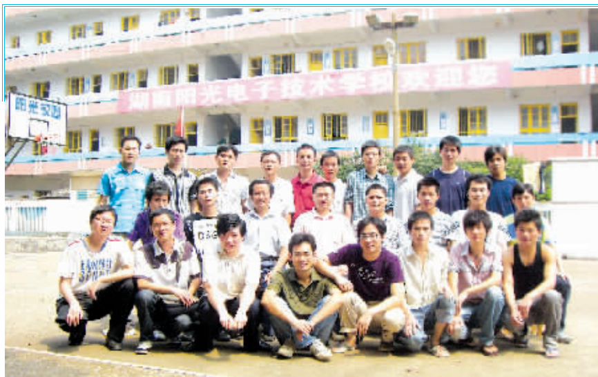
图为湖南阳光电子技术学校部分被推荐就业学生留影