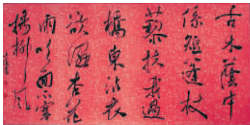
潘峰 诗一首 136×34