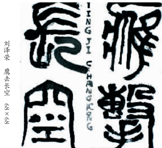
刘泽荣 鹰击长空 88×88