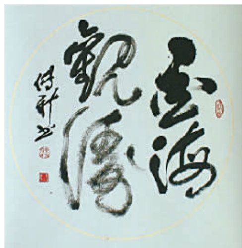
段传新 墨海观涛 88×88