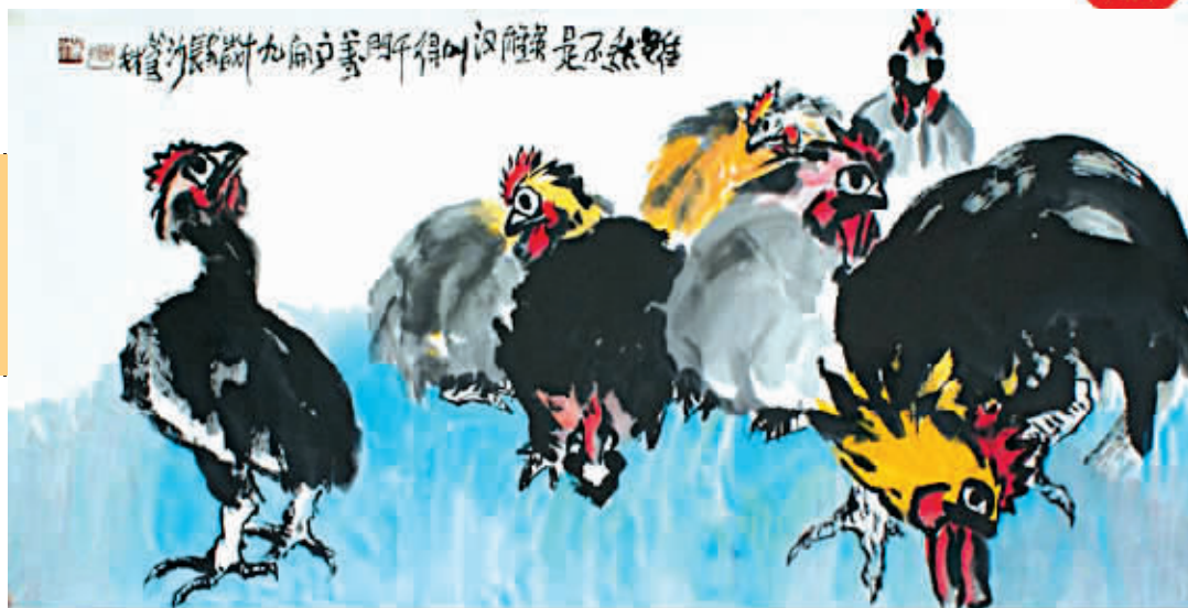
欧阳笃材 虽然不是英雄汉 136×68