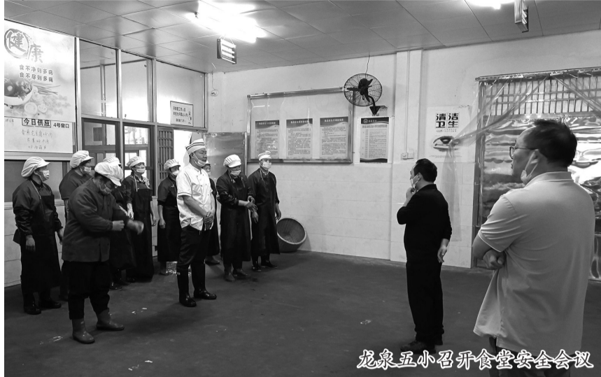
龙象五小召开食堂安全会议

从国企的标准化集配,到学校的规范化合验收,再到后厨的透明化操作,新田县用一条环环相扣、无缝衔接的链条,回答了食材“怎么来、怎么送、怎么做”的问