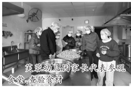
芙蓉幼儿园家长代表参观食堂、查验食材