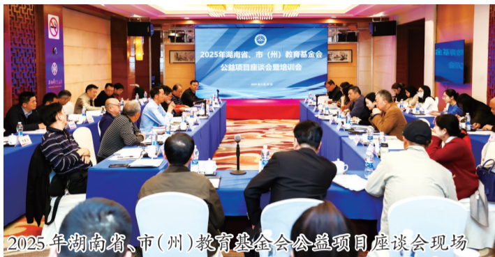
2025年湖南省、市(州)教育基金会公益项目座谈会现场