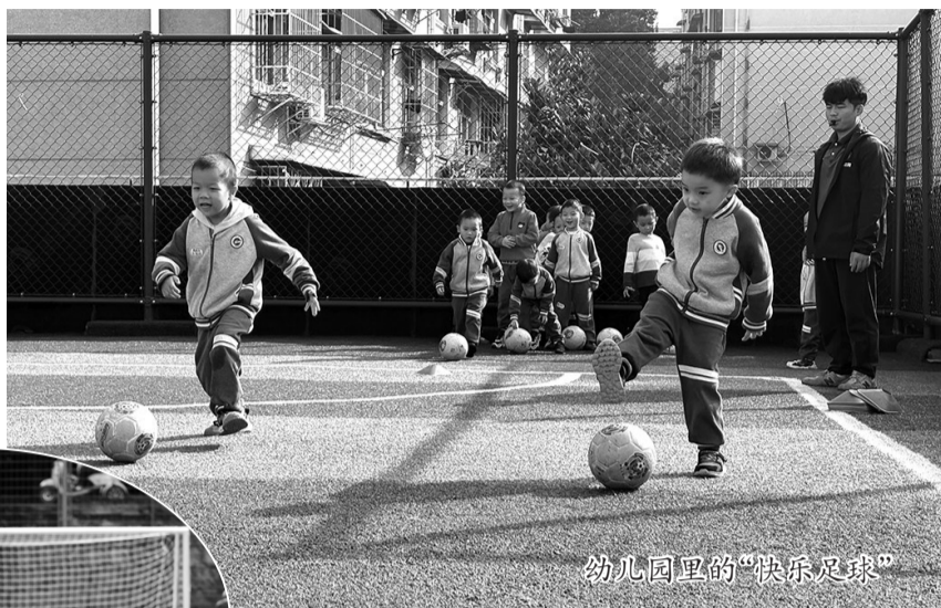
幼儿园里的“快乐足球”