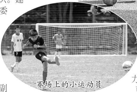
赛场上的小运动员