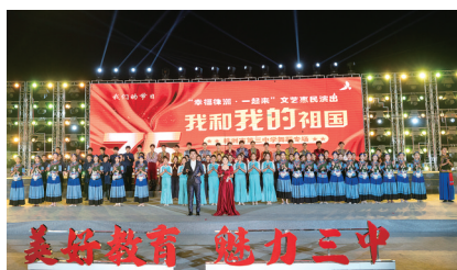
▲株洲市第三中学星火舞台演出现场

株洲市第八中学精心打造的“梦航音乐会”已经成为学校的一张名片、一个蜚声全省的知名品牌。截至目前,该校在湖南省中学生“三独”比赛中,40多名学生获金奖,7次荣获金奖第一名,已培养2000多名专业生迈入了理想的大学。