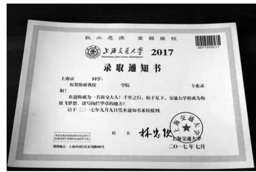
2017年上海交通大学录取通知书

因此,在古代报榜成了一份好差事,会得到一些“喜钱”。就是平民老百姓,也能摆上一桌,赏些酒喝。报榜人都是俸禄低微或者没有俸禄的衙役,他们报