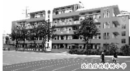
改造后的樟树小学

这种局面怎么破?大祥区教育人探索消除大班额的新路径——将两校合并,实行传统名校与薄弱学校一体化办学,将三八亭小学的一、二年级共计800余名学生放在了六岭校区。为了改善办学条件,2018年大祥区委、区政府拿出80多万元对六岭校区进行了提质改造,并计划将