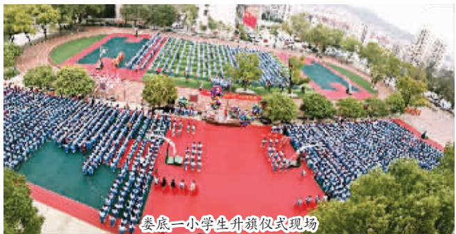
娄底一小学生升旗仪式现场

我省建立了义务教育经费保障体系,健全以国家财政投入为主的非义务教育成本分担机制,实现从“人民教育人人办”向“人民教育政府办”的重大转变,2017年全省义务教育财政拨款达725亿元,占义务教育经费比例的93%。建立普通高中、中职教育和高等教育生均拨款机制。2017年全省教育事业发展支出1051亿元,是1978年的400余倍。