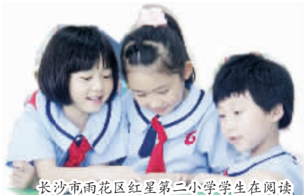
长沙市雨花区红星第二小学学生在阅读

40年间,湖南实现了从人口大省到教育大省的历史性跨越。截至2017年底,全省共有各级各类学校2.7万所,在校学生1317.8万人,在职教职工90.19万人,教育总规模居全国第7位。各级各类教育发展水平均超过全国平均水平,其中学前三、四年毛入园率、义务教育年均巩固率、高中阶段毛入学率、高等教育毛入学率分别高出全国平均水平1.44、4.2、3.2、0.58个百分点。