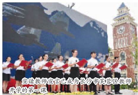
宣讲教师宣讲已成为长沙市芙蓉区教师开学的第一课

近年来,我省立德树人取得了突出成效。我省全面贯彻党的教育方针,坚持社会主义办学方向,构建起全员育人、全程育人、全方位育人的工作体系。持续推进党的创新理论进教材、进课程、进头脑。深入开展社会主义核心价值观教育,推动大中小幼德育一体化,实施大学生思想道德素质提升工程,广大学生理想信念更加坚定、爱国热情持续高涨、社会责任感显著增强、道德素质明显提升,涌现出全国道德模范周美玲、“野百合女孩”何玥姣、“向日葵女孩”何平等一大批先进典型。