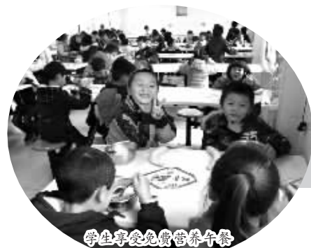
学生享受免费营养午餐

更让人欣慰的是,芦淞区教研室利用“主体性课堂”素质抽查的契机,专门针对戏曲教学结合音乐核心素养的三个维度制定了学生抽测表,对全区每个学校的任意一个班的孩子进行戏曲经典唱段和身段的抽测,收效非常明显,全区呈现“班班能唱戏、人人会唱戏”的场景,传统戏曲的种子已悄然在孩子们的心中萌芽。