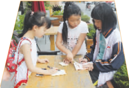
▲小记者交流采访心得。