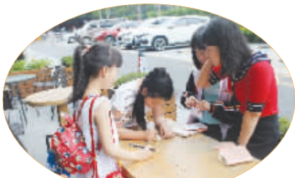
▲小记者在大记者的指导下，认真准备采访提纲。

“读万卷书，行万里路。”这次我向往已久的文化之旅，让我知道，在人生旅途中，还有很多知识宝藏等着我们去发现，去探索，去弘扬。