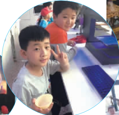
看看我们的3D打印成品