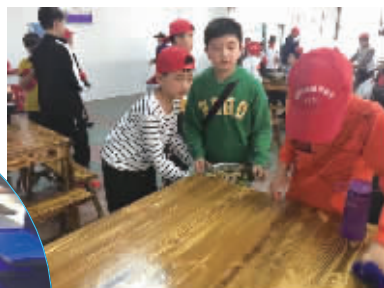
将餐桌收拾得干干净净