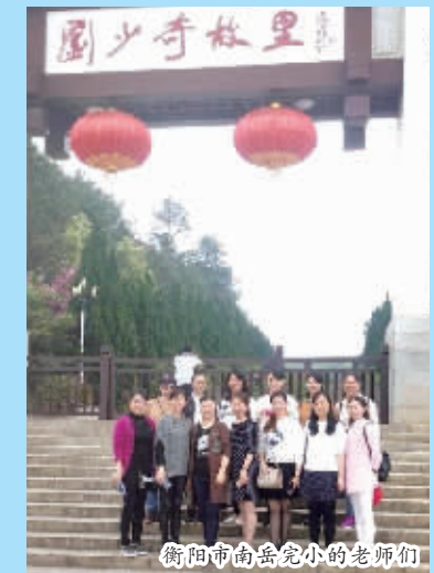
衡阳市南岳完小的老师们