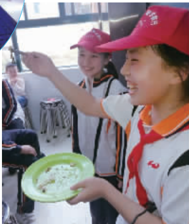
第一次做的菜怎么这么好吃呢