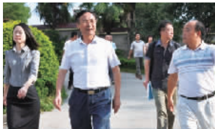
●新晃县长陆志前(左二)视察新晃二中

俗话说:“天下没有免费的午餐”。然而,在新晃,“免费午餐”不仅成为农村学生营养改善的普及项目,而且成为全县家喻户晓和引以为荣的公益事业。