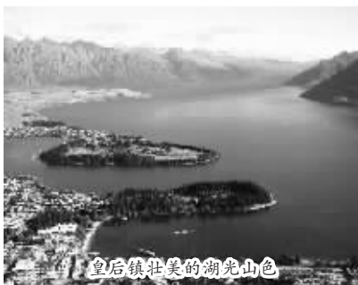
皇后镇壮美的湖光山色

游玩小 tips: 乘坐安斯罗号感受皇后镇的湖光山色;乘坐缆车登上鲍伯山,在山顶的观景台,可以看到令人惊叹的皇后镇和瓦卡蒂普湖的全景!山顶还有一个大型的餐厅,四周是落地玻璃窗,在欣赏美景的同时,还可以品尝美食;参加一年一度的“皇后镇冬季嘉年华”,由于地处南半球,季节与北半球相反,是避暑的绝佳选择。