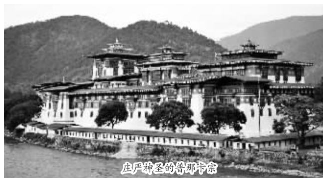
庄严神圣的普那卡宗

当年刘嘉玲和梁朝伟的那场低调而瞩目的婚礼,将世人的目光聚焦到不丹这个神秘而古老的国度。不丹号称全球“幸福指数”最高的国家,在这个遍地是古老建筑、未经开发的文明国度来一场悠哉的“慢旅行”吧,体验神秘的原真文化。