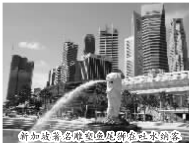
新加坡著名雕塑鱼尾狮在吐水纳客

新加坡是除了日本之外的另一个亚洲著名 baby friendly 的国度。新加坡国民都拥有极高的个人素质,整个国家不管从人文环境、地理环境都特别适合带小孩出行。