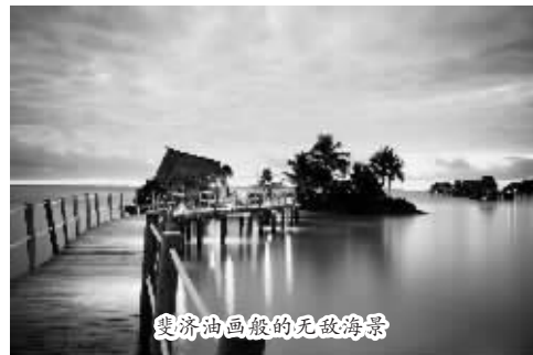
斐济油画般的无敌海景

温馨提示: 斐济属热带海洋性气候,每年的 5 月至 10 月,温度较低,平均气温为 22°,也是全年雨水较少的时期,因此比较适宜出行。