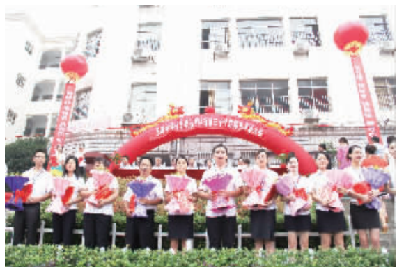
隆重的教师节表彰大会

做文雅学生。 为给每个孩子的终身幸福奠基,玉潭中学着力培养“举止文雅、谈吐温雅、内涵博雅、气质贤雅、品德敦雅、学识慧雅”的文雅学生群体。学校目前有在校学生4149人,无论是哪个年级,无论是哪个班级,无论是哪位同学,学校都对他们进行“雅韵”教育。学校专门编写了《雅韵集》等校本教材,为学生开设专门的课程学习“三雅”文化。每年的秋季学期,玉潭