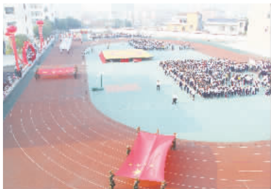
校园综合运动会开幕式