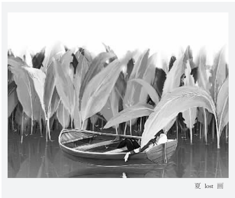
夏 lost 画

我也不喜欢隔间，所以设计师帮我用高度界定出3个不同的区域。我家最高的地方是客厅，朋友来的时候坐在最高的地方喝茶；次高的地方是书房，我在那边看书；再次高的地方是我的餐厅。我觉得这是我的房子、我的家，我是主人，我知道我要什么。