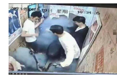
成都一小区电梯内电瓶车起火监控截图。