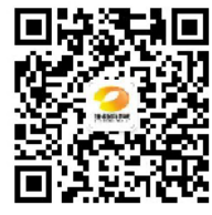
潇湘国际影城官方公众号。

只有精彩热闹的歌舞还不够，还有优秀的话剧对白；只有经典的民歌和交响乐还不够，还有搞怪的rap；只有一板一眼的普通话还不够，还有令人倍感新奇的湘西土话和苗语；只有一个好故事还不够，还有让人大开眼界的艺术表达！这就是《大地颂歌》——一场电影，多种艺术！