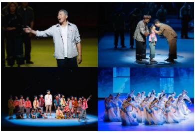
《大地颂歌》表演片段。

同时在舞台上，《大地颂歌》还利用LED屏幕，展现出巍峨高山、古朴苗寨等美丽的湘西景致。逼真的美景和别具风味的方言，最大程度地还原了湖南的风土人情。