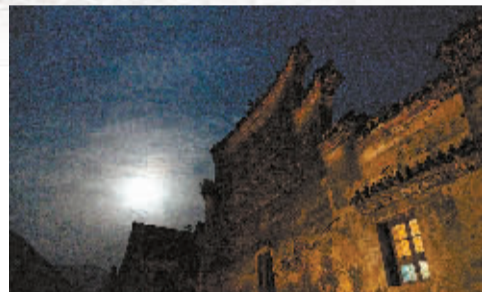
月光下的周家大院