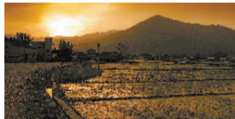
夕阳下的田园风光