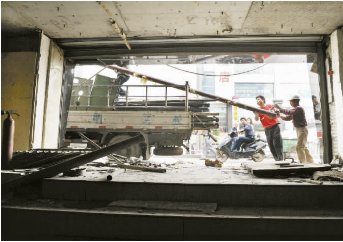
5月12日,施工人员在拆除长沙五一广场地下商场。当天,长沙地铁2号线五一广场站等4个地铁站启动建设。

随着承接沿海产业转移步伐不断加快,宁远县兴建了面积8平方公里的工业园,园内规模工业企业已发展到51家,还有加工贸易企业800多家,3万多农民在园内打工,就医成了一大难题。县委、县政府对此高度重视,把解决打工者看病难作为大事来抓。县内各主要医院设立了打工人员医疗专用窗口,优先给打工人员看病。同时,引导企业在员工健康投入上保证有一定经费,做到一个企业至少聘请一名医师、成立一个医务室、配备必要医疗器械和药品。企业还为打工人员代缴“新农合”参合金,组织他们定期体检、参加心理辅导讲座,并开通医务热线电话,购置医疗专车。目前,全县80%以上规模企业设立了医务室,实现了小病不出厂、大病有保障。