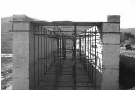
架设好的通道架梁。