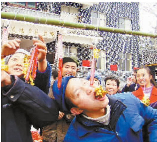
1月17日,龙山县洗浴乡敬老院里充满欢声笑语。39名孤寡老人参加了乡政府为他们举办的迎新趣味运动会。图为老人们正在参加“口咬食品”比赛。唐荣沛 田祖文 摄

汝城是我省最早实施小水电代燃料试点项目的7个县之一。项目自2002年启动以来,先后实施了电源建设、村网改造工程,在暖水、永丰、濠头等乡镇共16个村推广以电代燃料,5012户,20856人告别砍柴烧炭。如今,在当地很多农户家里,电饭煲、电热水器等家电一应俱全。据统计,以电代燃料每户每月用电量达110千瓦时,到户电价为每千瓦时0.36元。水利部门测算,项目区1年可节约薪用木材18万立方米,可节省砍柴劳力2356人,有效减少了水土流失和有害气体排放。