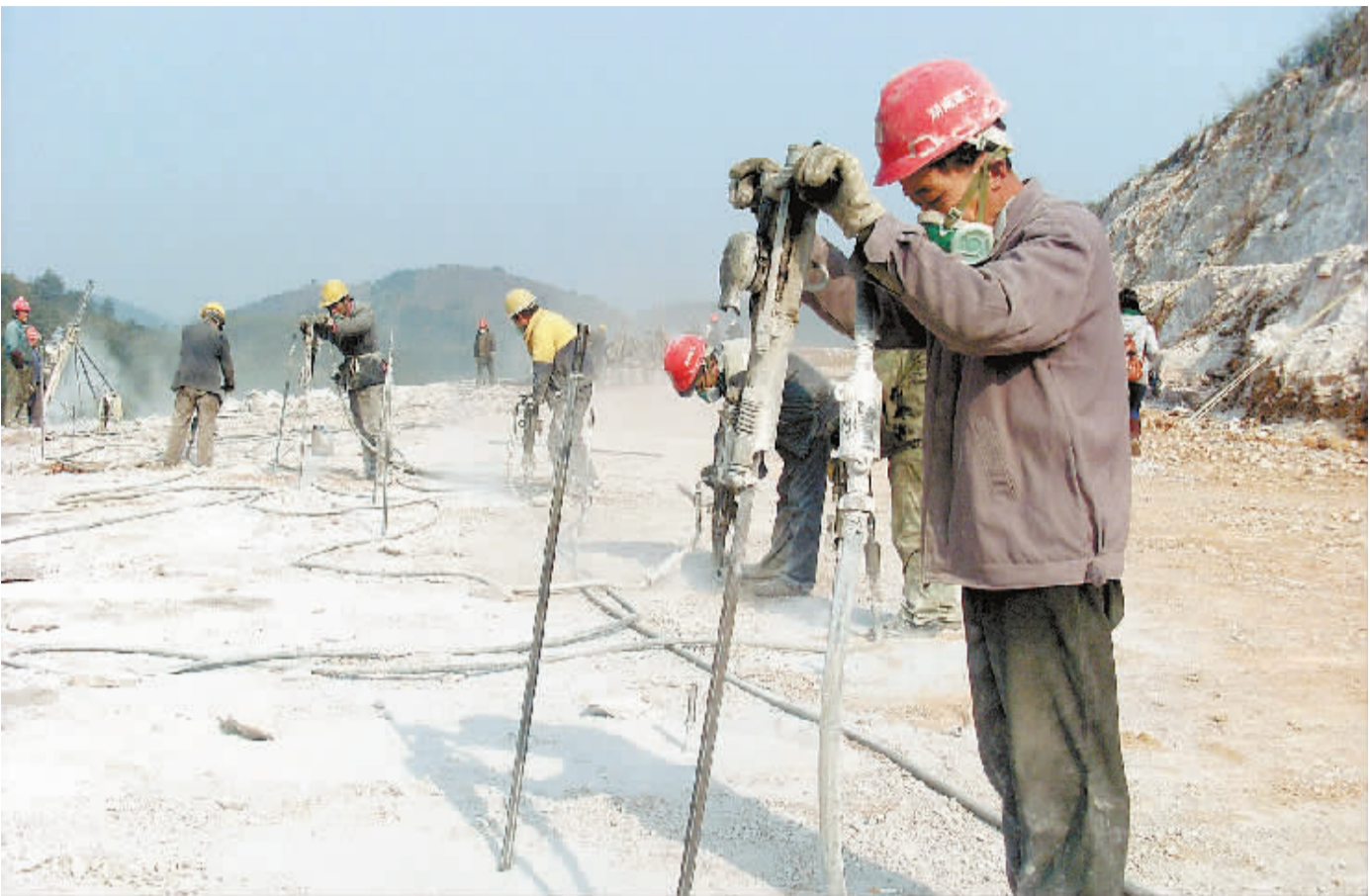
1月14日,建设者奋战在张花高速公路工地。张家界至花垣高速公路是湘西北地区连接二广、杭瑞、包茂等国家高速公路的重要通道。

从1月6日至12日,湖南艺术职业学院毕业生展演活动共推出7个演出专场,3个作品展览,同时举办大型毕业生就业招聘会。来自艺术团体、学校、企业等各方面100多家用人单位的代表在观摩、了解毕业生的实际才能后,与他们进行现场招聘洽谈,70%的学生与用人单位达成就业意向。