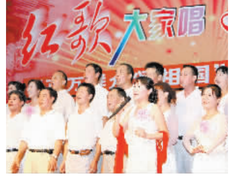
7月30日晚,长沙市开福区望麓园街道举行庆祝新中国成立60周年“红歌大家唱,快乐一家人”歌咏比赛,展现新时期家庭良好的精神风貌。