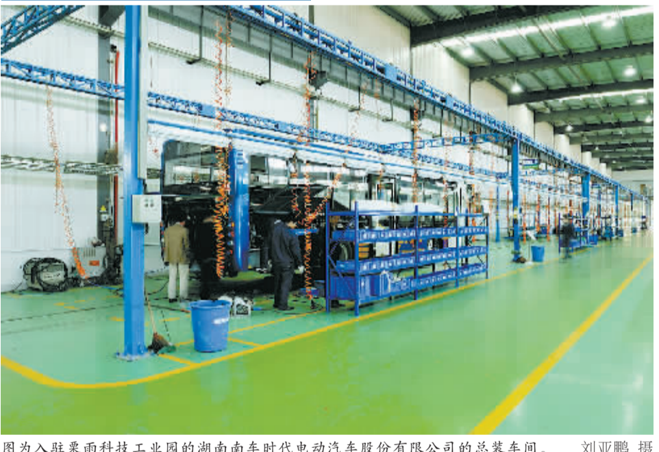
图为入驻栗雨科技工业园的湖南南车时代电动汽车股份有限公司的总装车间。

(紧接1版)如今,县纪检等部门接受群众投诉,随时有人下去查岗,干部们的去向、工作状态、接待来访、处理问题都纳入到机关作风考评范围。