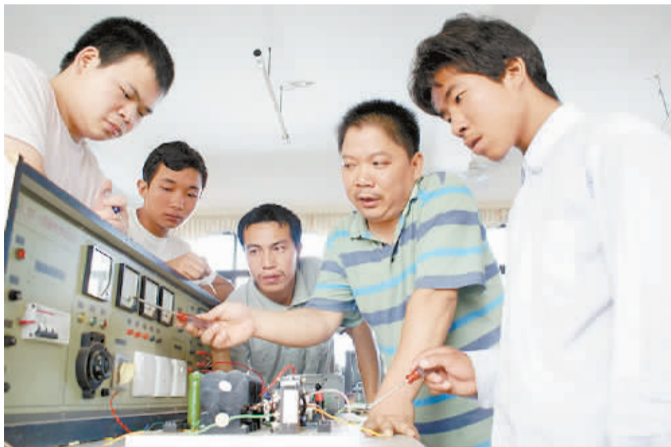
8月4日,几位残疾人在老师的指导下学习电工技术。城步苗族自治县把推进残疾人实用技能培训作为“为民办实事”的重要工作来抓,今年该县有70名残疾人经过培训后走上了工作岗位。

县公安局局长易学军听取情况汇报后,迅速调动局机关和城镇各派出所30多名民警上街紧急寻找小孩的亲人。“市民们注意了,谁家丢了孩子……”民警们冒着盛夏正午的烈日,穿梭于城区的大街小巷、超市、店铺……8台警车警报器,各种警用喇叭也一齐用上,在县城内一遍遍地喊着寻人启事。1个多小时过去了,寻访民警一个个已是汗流浃背。正在大家以为寻访无望时,一名四处张望、抹着眼泪的女子进入民警的视线。民警立即上前询问,原来她就是小女孩萱萱的姑姑霍某。据了解,萱萱一家住在辰溪县城郊乡大坪村。霍某带着萱萱一同进城逛街,当走到新华书店时,霍某想买几本书就带着萱萱一同进去了,就在霍某聚精会神选书时,萱萱竟然自己走了出去。