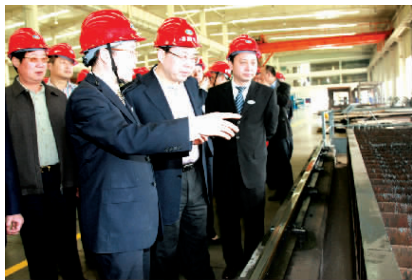
省委副书记梅克保(左三)考察永清环保集团产业基地

上半年,在实行一系列减负政策的大环境下,全省规模以上工业企业盈亏相抵后实现利润总额 212.19 亿元,同比增长 19.9%。其中,1—5 月同比增长 27.5%,增幅居全国第 2 位、中部第 1 位。从大类行业看,上半年全省规模以上工业 38 个大类行业中,有 23 个行业利润增长,1 个行业扭亏为盈,其中电气机械及器材制造业利润增长 55.2%,通用设备制造业增长 54.1%。经营效益稳定增长,为财政增收、扩大就业作出了积极贡献。上半年,全省规模以上工业实现利税 562.69 亿元,同比增长 16.0%;吸纳从业人员 212.40 万人,增长 5.2%;应付工资总额 209.03 亿元,增长 11.5%。在经济效益稳定增长的同时,全省工业企业的国内市场占有率进一步提高,1—5 月达 2.2%,同比上升 0.2 个百分点。从 38 个大类行业看,有 31 个行业的市场占有率同比提高,6 个大类行业的市