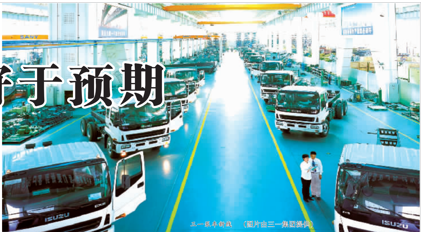
三一泵车新线

今年以来,国际金融危机影响持续加深,我省经济增长压力加大。面对复杂的国际国内经济环境,全省各级各部门认真贯彻中央和省扩内需保增长的一系列政策措施,深入推进“一化三基”战略,工业经济发展亮点纷呈,总体好于预期。