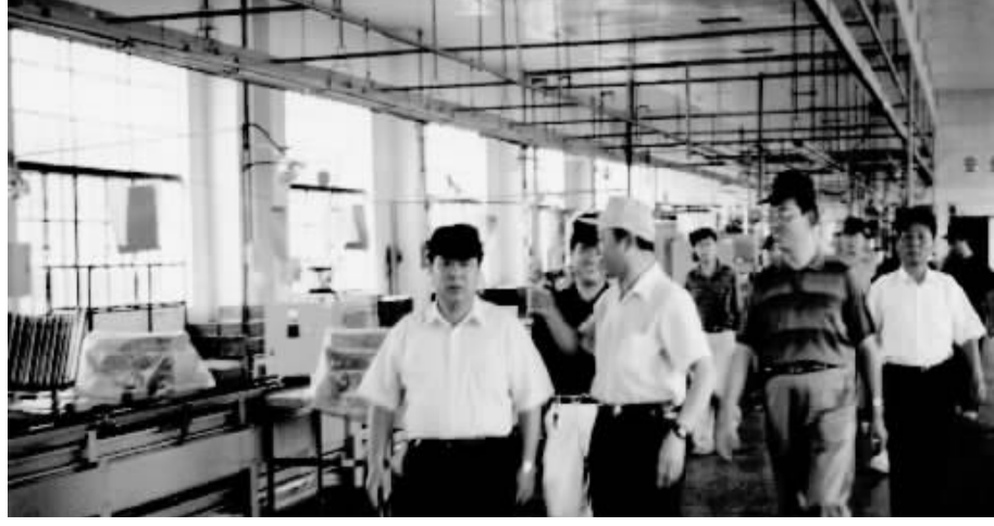
图为省国防科工办领导在中外合资企业华达汽车空调(湖南)有限公司调研指导工作。

元;南岭民爆股份有限公司与澳瑞凯公司合资合作,建设年产4000万发导爆管雷管和15000万米塑料导爆管生产线,可望年底投产;江南公司与浙江众泰控股集团合作建设江南汽车