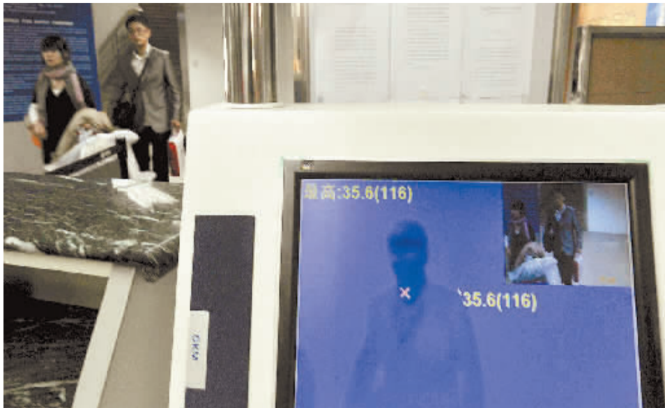
4月28日,武汉天河机场启动出入境旅客体温监测防控猪流感。

会议指出,当前一些国家发生的人感染猪流感疫情,已成为全球高度关注的公共卫生事件。党中央、国务院高度重视在墨西哥等国发生的人感染猪流感疫情的发