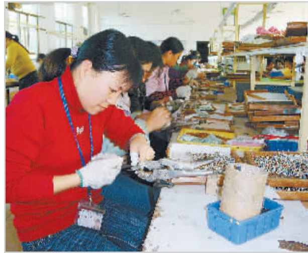
为应对金融危机给企业造成的困难,安仁县对60多家大小企业进行重点扶助,促进他们轻装上阵,产销兴旺。图为该县振宏电子厂在加工出口电子产品的繁忙景象。何炳文 摄

支部(小组)。同时,市委将“党员风采在社区”、“社区党员活动日”活动推向高潮。活动开展以来,有6326名党员志愿者、党员义工组成了500多支党员义务巡逻队、卫生保洁队、文明劝导队定期上街进巷,有4563名在职党员在社区认领了文明教育、纠纷调解、医疗卫生、结对帮扶等8小时之外的“社会岗位”。前不久市委组织的一次“党员风采在社区”活动,310多名机关党员走进紫云社区,清扫大街小巷、上门扶贫问苦、现场调解纠纷、文明劝导,把整个社区闹得热火朝天。