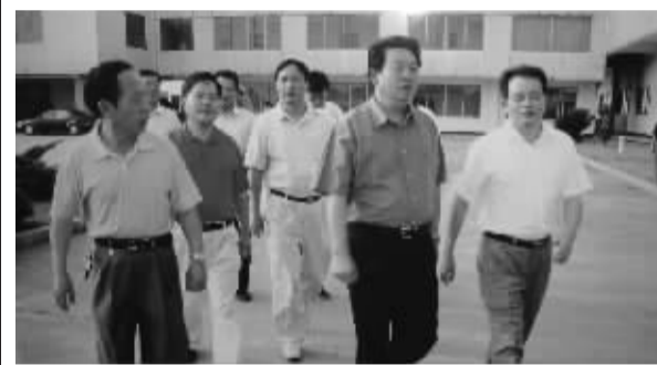
省食品药品监督管理局局长张光荣(左一)和原益阳市委书记蒋作斌(右二)来公司考察

湖南汉森制药股份有限公司的前身为益阳制药厂,位于益阳市银城南路龙岭工业园,总占地面积44523平方米,建筑面积26625平方米,是湖南省重点医药工业企业和