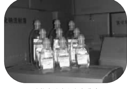
公司推出的塑瓶新包装产品

湖南康源制药有限公司(生产地址:益阳市赫山区大利路17号)其前身是益阳生物化学制药厂,始建于1982年,1992年更名为益阳碧云制药厂。1999年企业改制为民营企业,更名为湖南益阳碧云制药有限公司,在益阳市工商行政管理局注册登记,注册资金665万元人民币,注册地址为益阳市赫山区大利路17号。2001年公司投资500万元对玻璃瓶大容量注射剂车间进行改造,2002年3月13日取得《药品GMP证书》。为