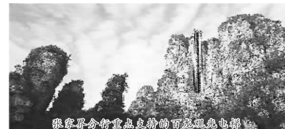
张家界市分行重点支持的百龙观光电梯

随着该市旅游业的快速发展，为缓解电力紧张矛盾，该行把水电开发作为业务拓展重点。上个世纪末，先后独家经办了江垭等4个大中型水电项目，累计贷款达