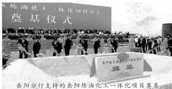
岳阳分行支持的岳阳炼化一体化项目奠基

前程光明无限，岳阳建行人没有小富即安，而是努力以科学发展观为指引，逐步实现业务发展与员工收入双提升；竞争日益激烈，岳阳建行人没有畏难退缩，而是不断改进服务方式，强化内控管理，加大优质项目营销力度。2008年，岳阳分行积极跟进中石化长炼分公司1000万吨大炼油项目，工程项目建设总投资约70亿元。作为中石化长炼分公司的长期战略合作伙伴，建行从总行、省行及岳阳分行都十分重视。多次登门拜访，寻求总行的支持，岳阳分行受到长炼的高度重视。10月18日，省行龚蜀雄行长作为唯一的银行系统代表应邀出席中石化长炼分公司1000万吨大炼油项目开工典礼，