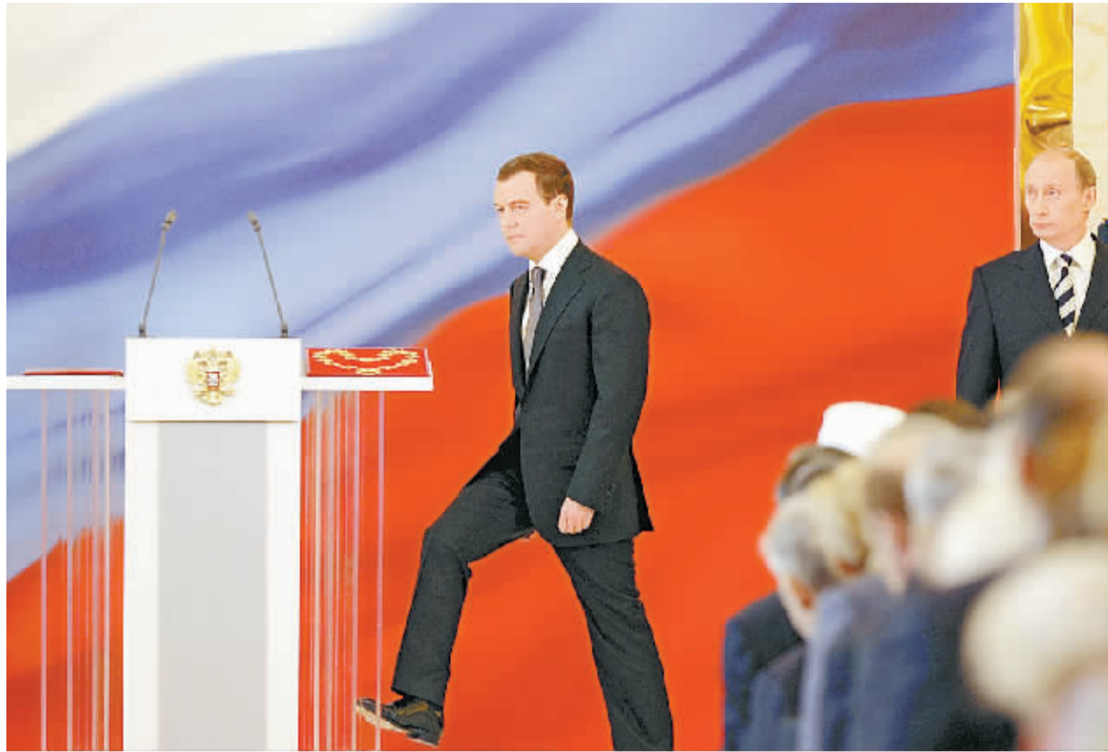
2008年，国际政坛波谲云诡。从创造历史并为美国政治生态带来大裂变的首任非洲裔总统奥巴马，到格有“普京印记”、延续“普京路线”、书写大国神话的梅德韦杰夫；从日本内阁一年之内两易其主，到泰国政坛走马灯似的总理“出炉”……这是2008年5月7日梅德韦杰夫（左）和普京（右）在参加总统宣誓就职仪式。