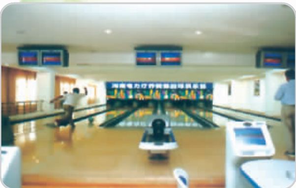
设施一流的室内保龄球馆