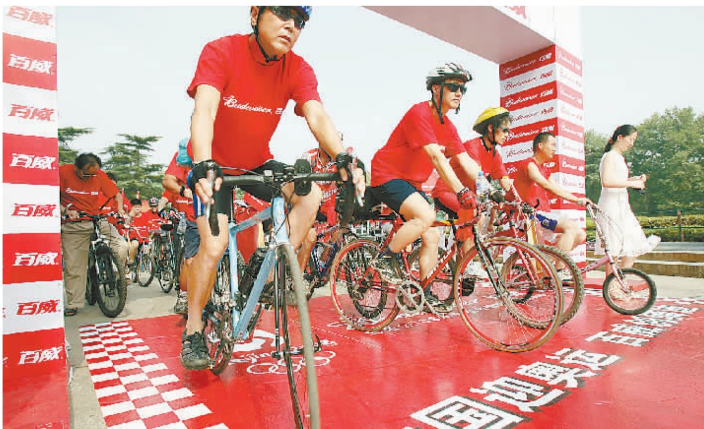
自行车运动越来越受到我省许多人的青睐,自行车运动装备等与之相关的体育消费也随之红火起来。图为今年6月在长沙举行的自行车赛。

北京筹办和举办奥运会除了使更多的我省群众参与到乒乓球、游泳、羽毛球等一般体育项目的健身消费之外,也正逐渐刺激着包括网球、高尔夫球、户外登山等高档休闲运动消费的升温。今年,我省成功举办4次高尔夫球赛,并于11月举行了首届高尔夫球团体对抗赛,标志着我省参与高