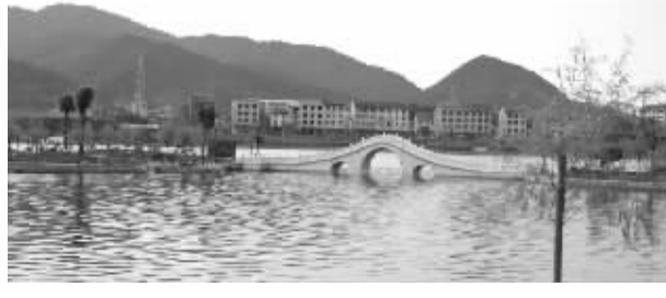
临湘城区环境优美,图为城中之湖——白云湖。