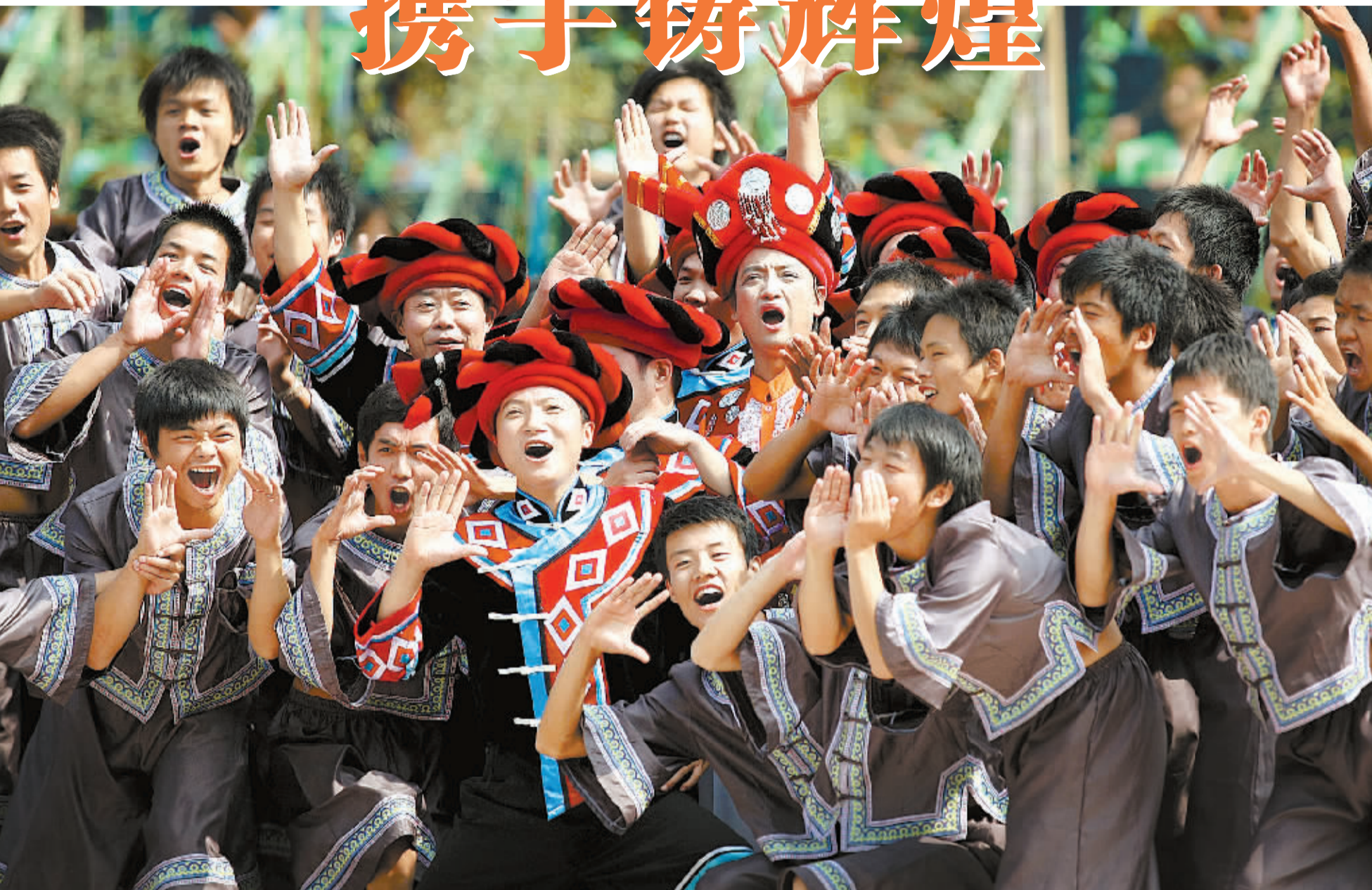
在2008年中国湖南国际旅游节上，省民族歌舞团演员表演民族舞蹈《敲击生命》，让世人领略到“锦绣潇湘·快乐湖南”的无穷魅力。

是什么掀起了这片土地神秘的面纱？是何力量驱使古老的民族地区焕发出勃勃生机？是改革开放。沐浴着改革开放的春风，我省民族地区基础设施大为改善，天堑变通途、玉带绕山峦；民族地区干部群众观念为之更新，上天赋予的自然资源成了一个美丽的旅游景点，当地的资源优势变成了经济优势；民族地区独有的文化、民俗风情得到了传承与发扬。