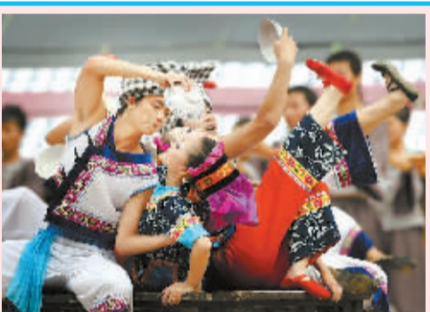
张家界充分挖掘具有浓郁民族气息的歌舞，吸引世界各地的旅游者，有力促进了民族事业大发展。