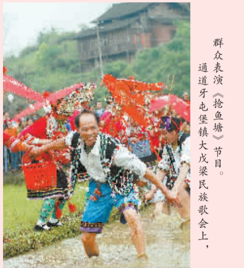
群众表演《抢鱼塘》节目。通道牙屯堡镇大戊梁民族歌会上。