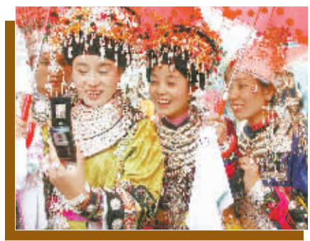
改革开放以来，少数民族地区人民生活水平日新月异。图为凤凰县山区的苗族姑娘用上了手机。