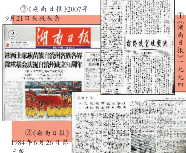
年七月二十一日头版

目前，全省党政机关、国有集体企事业单位有少数民族干部人才15.9万人，占全省干部人才总数的10.26%，比2000年净增1.2万人。省委组织部、省委统战部和省民委先后选派300多名少数民族干部赴中央国家机关和外省发达地区挂职锻炼。全省少数民族专业技术人才和经营管理干部茁壮成长。民族干部队伍不断壮大，素质不断提高，结构趋于合理，促进了民族地区的发展与繁荣。