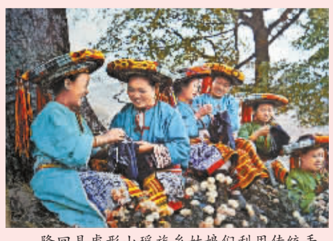
隆回县虎形山瑶族乡姑娘们利用传统手工编织工艺品。