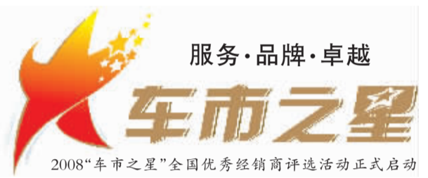
2008“车市之星”全国优秀经销商评选活动正式启动

2004 年成立至今,广州丰田已经成南中国汽车产业的一颗璀璨明星。2006 年 5 月,广州丰田工厂正式投产;6 月,承载无数期盼的中高级车凯美瑞国产上市,并迎来百店同时开业。凯美瑞在当年一举夺得 48 项年度车殊荣;2007 年,凯美瑞以 17 万台的佳绩荣登年度中高级车销量冠军;2007 至 2008 年间,凯美瑞更连续 16 个月荣登中高级车月上牌量冠军宝座;2008 年 6 月,上市两年的凯美瑞即缔造了 30 万台的产销业绩。广州丰田的第二款产品——精品小型车雅力士也于当月上市。目前,广汽 TOYOTA 旗下开业经销商已经达到 156 家,遍布全国各地。为扩充产能,广州丰田第二生产线也正在建设中。(章敬)