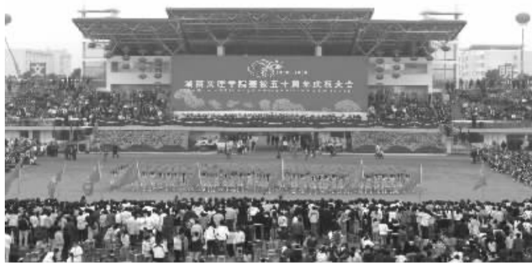
建校50周年庆典会场

2008年11月9日，湖南文理学院隆重举行建校五十周年庆典。教育部和省委、省政府发来贺电。省领导刘力伟、唐之享、刘晓参加了庆典，并对学校五十年办学成就给予了高度评价。教育部和省直有关部门及常德市委、市人大、市政府、市政协领导出席。国内外150多所高校的领导前来祝贺或发来贺电。海内外校友和嘉宾共30000余人来校