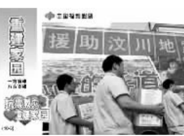
福彩刮刮乐今年销量已突破60亿元

上述赈灾套票的返奖率全部为65%，中奖率约为30%，即平均每三四张彩票就有1张中奖。简单好玩易中奖，头奖奖金也是相当的丰