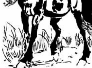
岳阳城陵矶新港有限公司

城陵矶新港位于岳阳市城陵矶，是全省区位优势最好、吞吐能力最大、现代化程度最高的集装箱港口。城陵矶新港区总体规划为13个泊位，共分三期建设，总投资16亿元，目前一期工程已完成投资7亿，建成3个3000吨级集装箱深水泊位（同时兼顾5000吨级江海轮靠泊作业），设计年