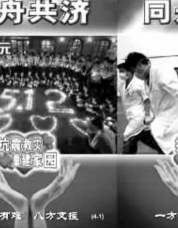
福彩刮刮乐今年销量已突破60亿元

上述几大品种赈灾主题福利彩票以套票形式发行，彩民可单张购买，自行收集成套。值得一提的是，票面设计精美，紧贴抗震救灾主题。此次“福彩赈灾公益金”专项募集主题票每一款彩票的票面都是以“5.12”特大地震灾害为主题，突出体现了在这一巨大的自然灾害面前，中国人民众志成城、军民鱼水情深等感人场面，图片感染力强，催人奋进，令人震撼。这也是国内首次为地震灾害发行的福利