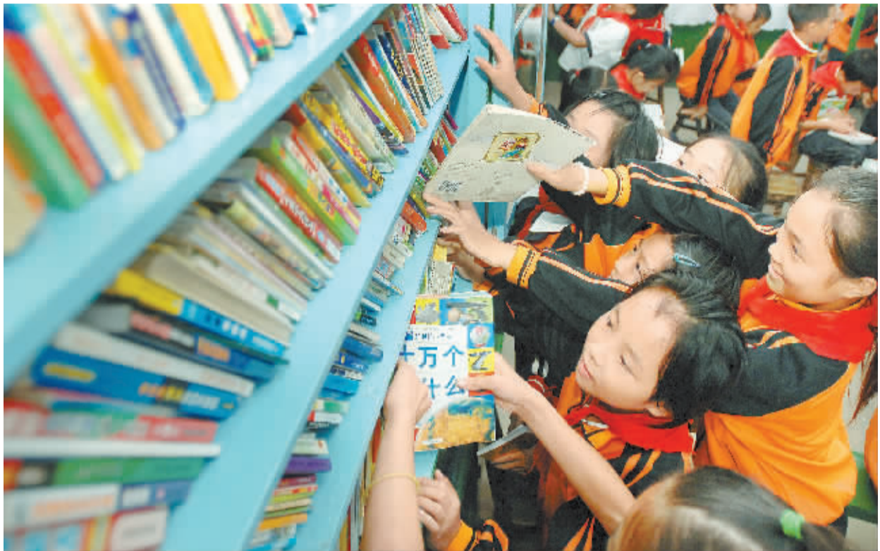
9月26日,宁乡县横市镇铁冲学校四年级学生在新落成的图书馆开心地阅读。当日,华润怡宝“1+1中华强”5所爱心图书馆和体育课堂落成暨挂牌仪式在宁乡县横市镇举行,来自长沙市50所中小学校和株洲、湘潭等五地的爱心人士捐赠了8万多册爱心图书和近2万件体育用品送到宁乡县偏远山区学校。

此次国庆节正与九九重阳节相连,南岳景区精心推出“南岳祈福 重阳感恩”游,盛情邀请八方客人来南岳祈福感恩,并为老人提供免费。届时凡年满60岁、在九九重阳节前后(9月29日-10月7日)过生日的老人来南岳将免费参加一系列旅游活动。此外,南岳还将为喜爱户外探险的朋友量身推出“户外探险、野营体验”游,首次推广南岳衡山户外探险、攀岩、野营等旅游产品。探险路线包括广济寺、禹王城、龙溪溪、紫盖峰、水帘洞等多个奇、险景点,让游人尽情领略南岳的秀美与神奇。