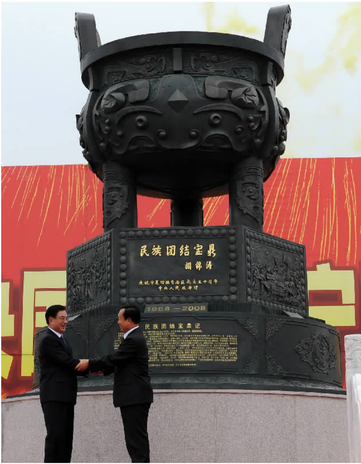
9月22日下午,由胡锦涛总书记亲笔题写鼎名的“民族团结宝鼎”赠鼎仪式在宁夏博物馆宝鼎广场举行。图为贺国强(左)和宁夏回族自治区党委书记陈建同为宝鼎揭幕。

据新华社银川9月22日电 22日下午,中共中央政治局常委、中央纪委书记、中央代表团团长贺国强率代表团全体成员,先后参观了位于银川市区的宁夏博物馆和在银川国际会展中心举行的宁夏回族自治区成立50周年成就展。