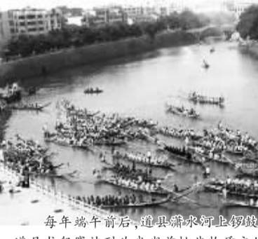
每年端午前后，道县潇水河上锣鼓喧腾，近百艘龙舟展开激烈角逐。2006年，道县龙舟赛被列为我省首批非物质文化遗产。

“心中为念农桑苦，耳里如闻饥冻声”，“道之纯厚，遇之有实，虽不言曰‘吾亲民’，而民亲矣。”亲民书记易光明自任县长到书记的8年多来，一直默默地恪守着民本的理念。和谐是经济社会科学发展的目标，是人类身心健康的至善追求。近几年来，道县县委、县政府始终坚持执政为民这一根本宗旨，统筹兼顾、努力改善民生，力促和谐。和谐首先是认真落实惠农政策护民利。因此，该县县委、县政府把落实各项