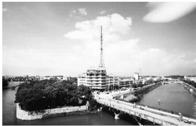
美丽的道县城区一角

改革三十年，岁月的年轮成为精彩的记忆。在这片充满生机与活力的土地上，都庞岭雄风万里，潇水河奔流不息。从蕴藏古代耕种文明的玉簪岩到现代工业区，人类社会的发展留下了如此自强不息的足迹。